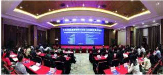
参加合同能源管理研讨会的与会者

2018 第二季度，ANSI 举办了中美标准与合格评定项目(SCCP)第四阶段的最后两场研讨会，详情如下：