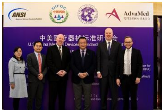
图为出席中美医疗器械标准研讨会的演讲嘉宾

美国国家标准化机构(ANSI)继续实施第五期中美标准与合格评定合作项目(SCACP)。2019 年第一季度，ANSI 组织了以下研讨会：